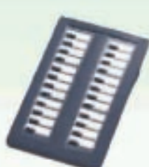
AOM (Puesto Operadora)